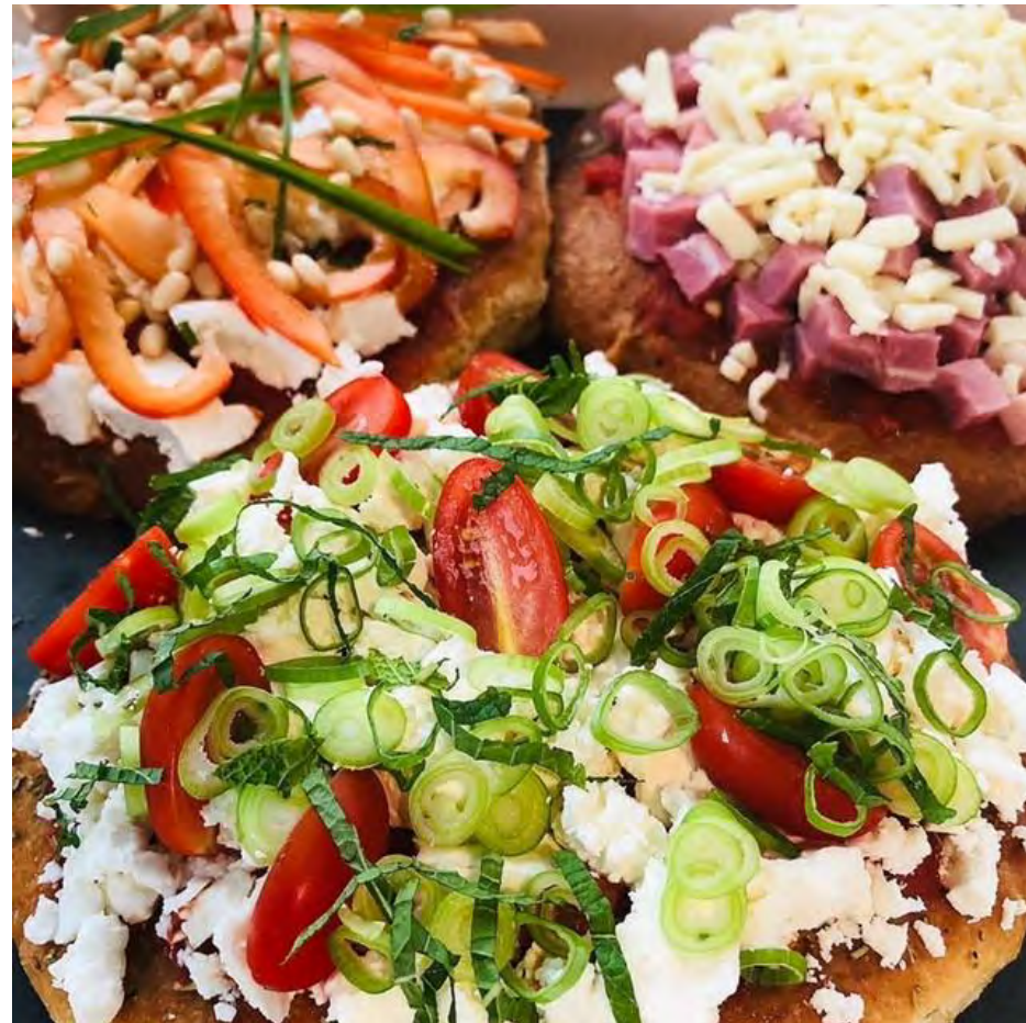
FOCIZZA (= focaccia met pizzatopping)